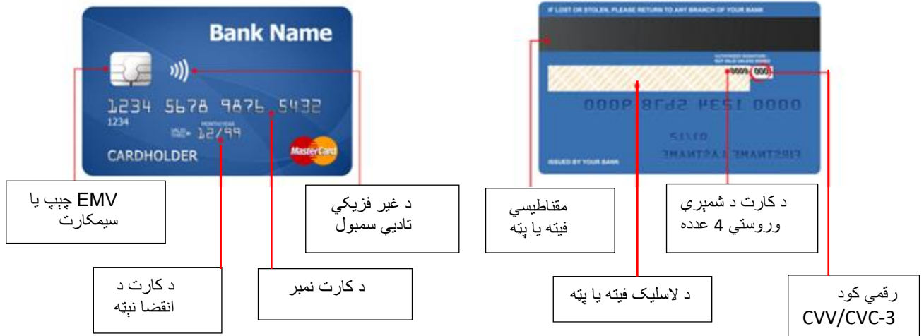
د کارت مخ

که چېرې تاسو د بانکي چک اکونټ پرانيږئ، نو پدې صورت کې کېدی شي بانک تاسو ته ځيني چکونه درکړي چې شکل به يې په لاندې ډول وي: